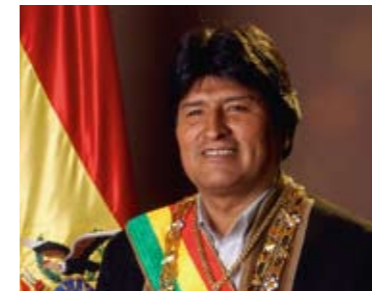
Evo Morales vill att hela världen ska rösta.

Missnöjet med klimatmötet i Köpenhamn har fått Bolivia att i mitten av april anordna ett eget klimatmöte. Men i stället för FN-möte blir det denna gång en internationell "Folkets konferens om klimatet och Moder Jords rättigheter". Landets president Evo