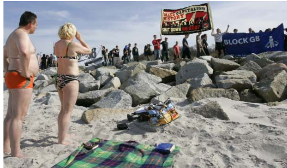
Unheimliche Begegnung der dritten Art: Urlauber und Globalisierungsgegner, fotografiert im Vorfeld des G8-Gipfels in Heiligendamm.

Trotz mancher Erfolge: Vieles, was sich die G8-Führer vornehmen, bleibt Stückwerk. Sie sind nämlich, anders als die „Globalisierungsgegner“ glauben machen, nicht allmächtig: Wer zu viele Zusagen macht, um etwa den Afrikanern mit freierem Welthandel zu helfen, der wird zu Hause vom Wahlvolk abgestraft. ULRICH VON LAMPE